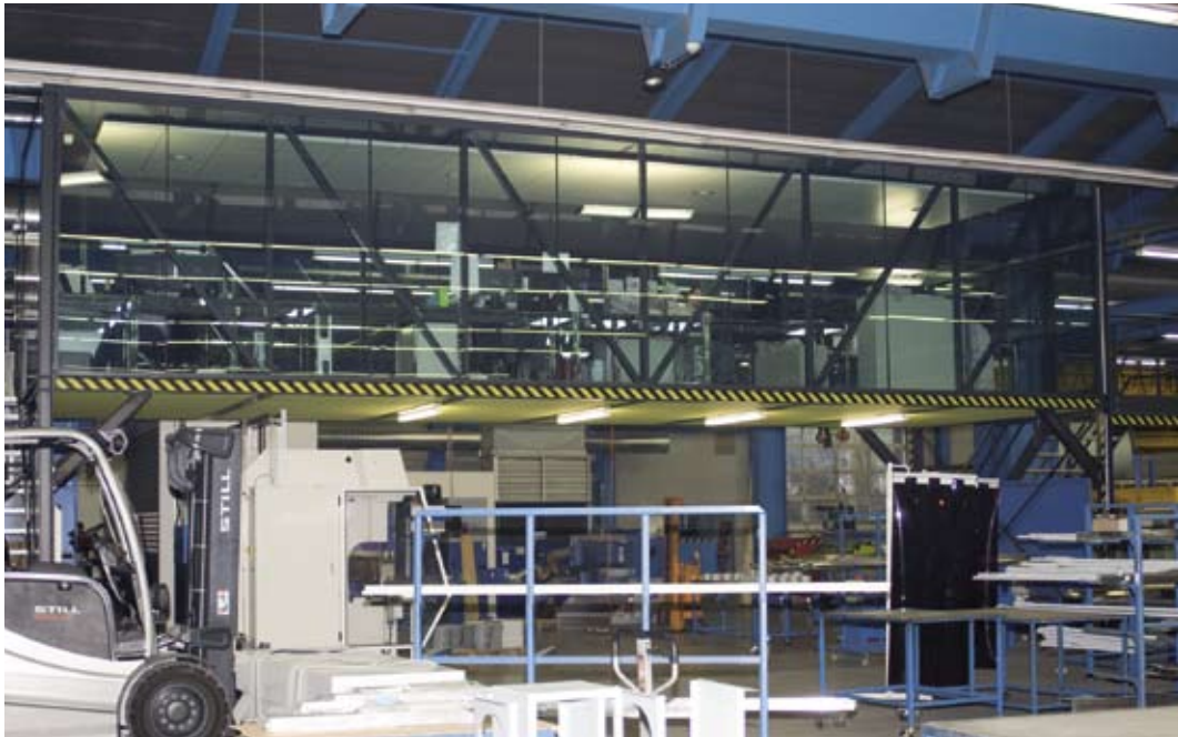
Das neue Büro der Arbeitsvorbereitung mit Überblick über die Produktionshalle.

Familie und Arbeit sind wichtige Eckpfeiler des täglichen Lebens. Der Familientag der Lippuner Energie- und Metallbautechnik AG, Grabs mit rund 250 Besucherinnen und Besuchern vereint diese. Ein Erfolg und Motivation zugleich für eine gemeinsame, erfolgreiche Zukunft.