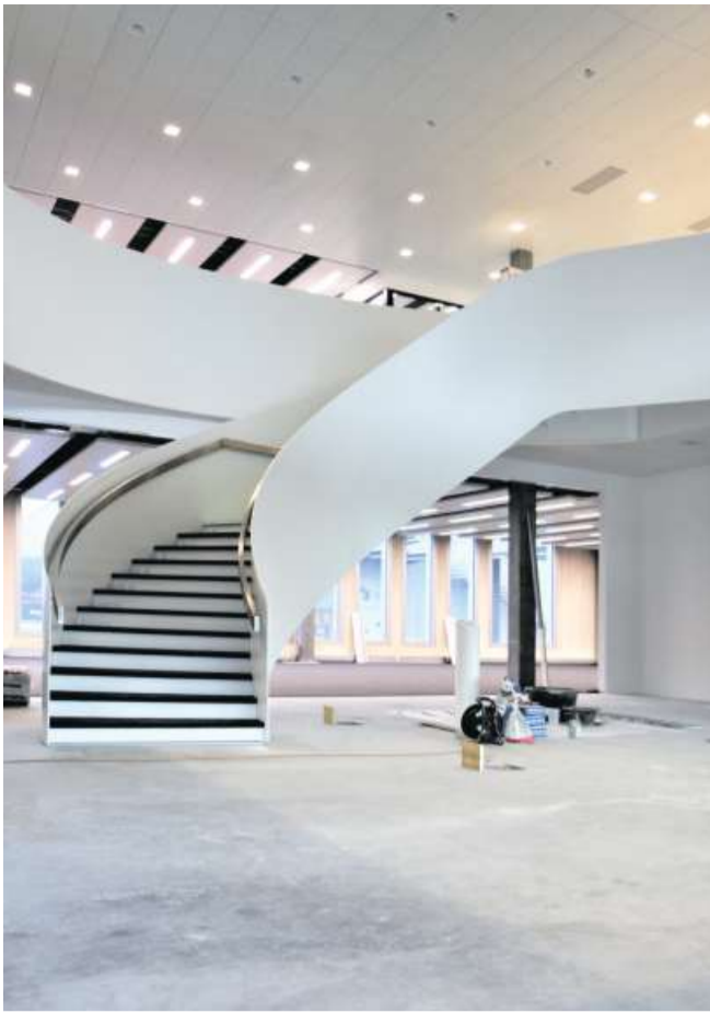
Die imposante Metallbau-Treppe Eigenbau Lippuner ist ein Blickfang im repräsentativen Eingangsbereich.