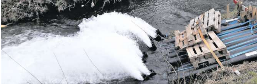
Während 180 Tagen wurden im Mittel 24 000 Liter Grundwasser pro Minute in den benachbarten «Giessen» befördert, was etwa dem 100fachen Volumen des Werdenbergersees entspricht.

spannendes Umfeld bieten und Menschen aus Bildung, Forschung, Innovation und Wirtschaft miteinander vernetzen. Durch den gegenseitigen Austausch sollen Synergien geschaffen werden, welche die Stadt Buchs als Bildungs-, Forschungs- und Wirtschaftsstandort langfristig stärken. Weitere Projekte sind in Planung. So sollen in naher Zukunft ein Campus-Motel und ein Neubau der International School entstehen.