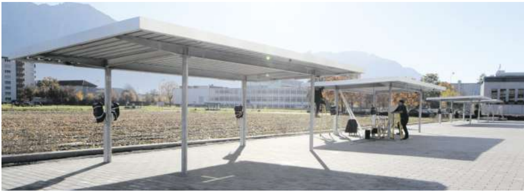
Bei diesem Industriebau wurden 1453 PV-Module verbaut. Die Elemente an der Fassade, auf dem Dach und den Carports erzeugen eine Leistung von 450 kWp.