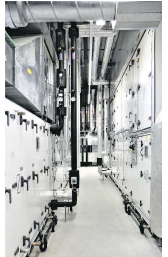
Beeindruckend ist sicherlich die Grösse der Lüftungszentrale unter dem Dach.