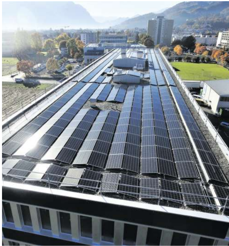
Das Gebäude ist ein nachhaltiges Kraftwerk. Die gesamte Gebäudetechnik für Lüften, Heizen und Kühlen wird komplett mit erneuerbaren Energien betrieben..