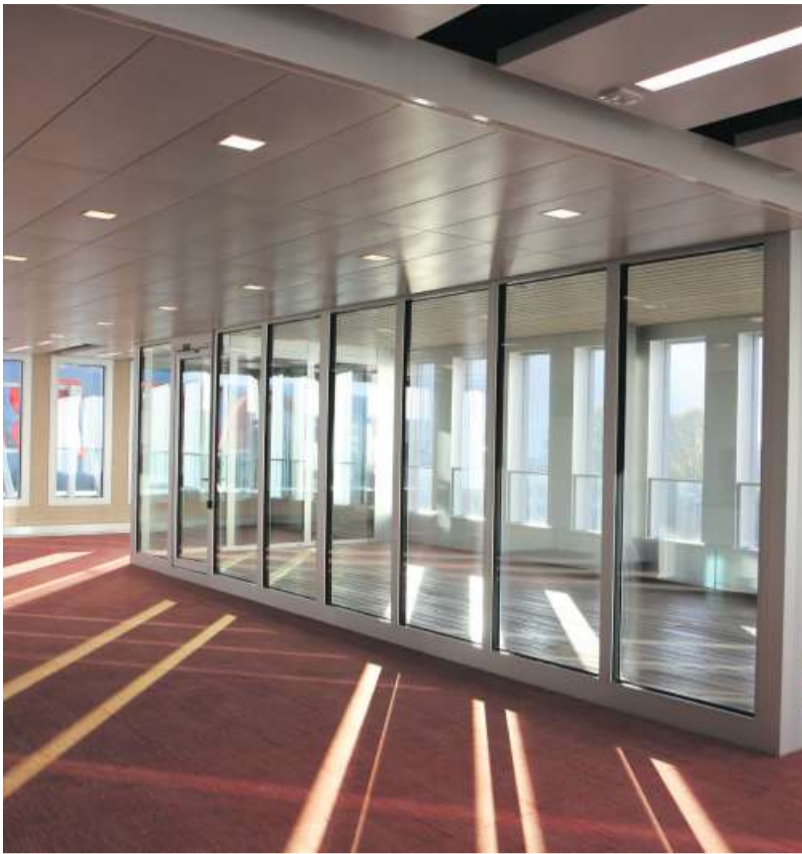
Im hellen, lichtdurchfluteten Pausenraum mit der angrenzenden Loggia werden sich auch Mitarbeitende wohl fühlen.