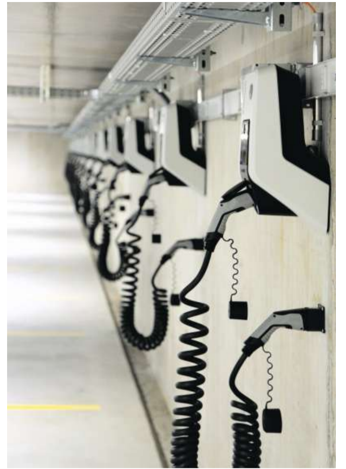
Die Parkplätze in der Tiefgarage sind zu einem Grossteil mit Ladestationen ausgestattet.

Die Verwendung des nachwachsenden Baumaterials macht aus ökologischer Sicht Sinn und verleiht dem Gebäude innen durch die sichtbare Holzoptik einen wohnlichen, warmen Charakter. Aussen wurden die Holzelemente mit Aluminiumblech verkleidet. Die Brüstungsbänder sind mit Photovoltaik-Modulen bestückt. Die Fassade wurde eigens für dieses Gebäude entwickelt und mit einem 1:1-Fassadenmuster die gesamte Konzeption optimiert. So ist eine ästhetisch ansprechende Fassade entstanden, die auch wirtschaftlich überzeugt.