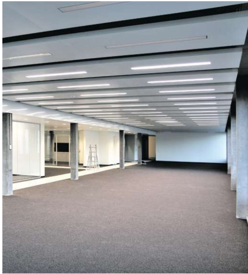
Modernste Büro- und Aufenthaltsmöglichkeiten werden dem Mieter zur Verfügung gestellt.